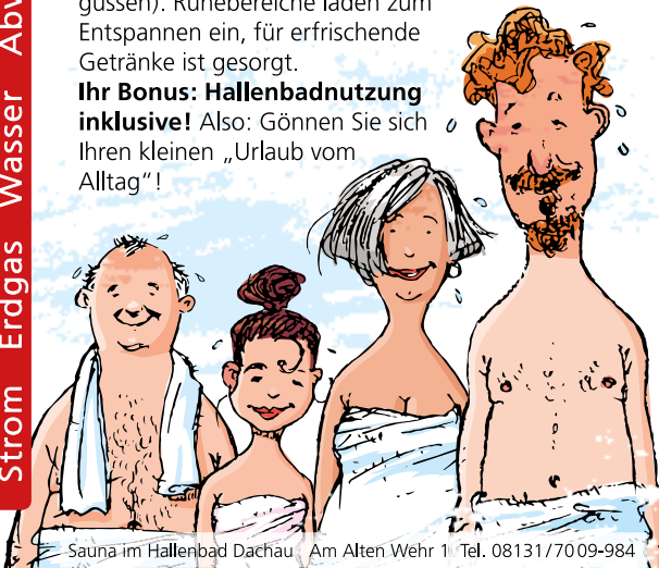
Sauna im Hallenbad Dachau, Am Alten Wehr 1, Tel. 08131/7009-984

Ihre Lebens qualität ist unser Job! www.stadtwerke-dachau.de