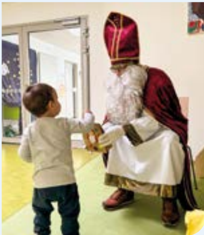
Der Nikolaus besucht das Kinderhaus.