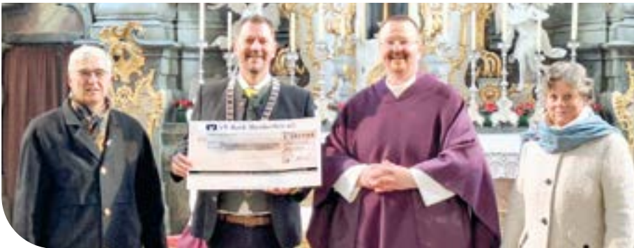
Scheckübergabe in Oberammergau.